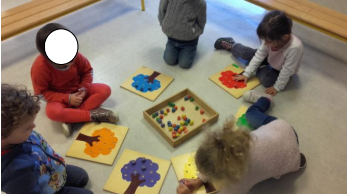
Nous avons découvert le « jeu de l'arbre ». Il faut lancer un dé, puis prendre une « pomme » de la bonne couleur.