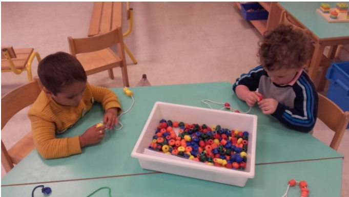
Nous avons fait des colliers en utilisant une seule couleur, et en essayant de la nommer.