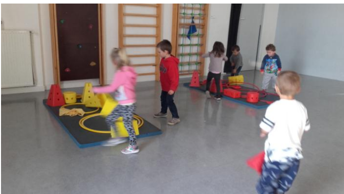
Avec les élèves de moyenne section, nous avons fait une course pour trier des objets en fonction de leur couleur.