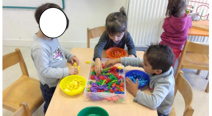
Nous avons trié des petits personnages, en les mettant dans le bol de la même couleur.