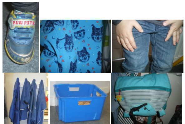
Nous avons fait une « chasse à la couleur bleue ». Il ne fallait prendre en photo que des choses de couleur bleue.