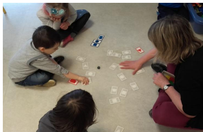
Nous jouons au jeu des formes. Il faut retrouver les mêmes formes que sur le dé, et de la bonne couleur. (TPS-PS-MS)