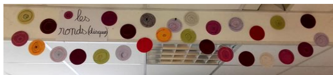
Et voilà le résultat une fois les guirlandes de formes accrochées au plafond ! (MS)