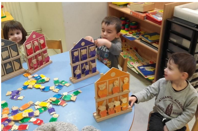
Nous remplissons nos maisons avec les animaux de la bonne couleur, en les nommant. (TPS/PS)