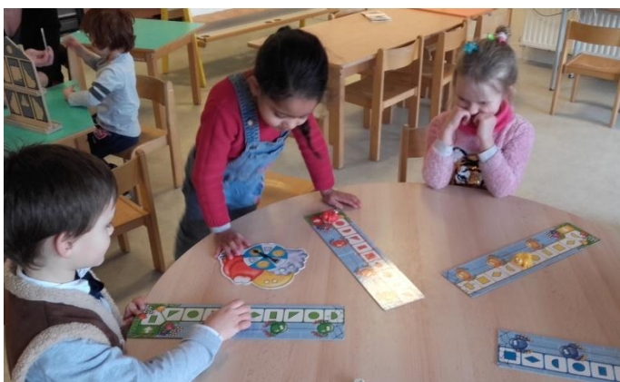
Nous jouons au jeu de l'araignée Gypsie. Il faut reconnaître des formes pour pouvoir faire avancer notre araignée. (PS-MS)