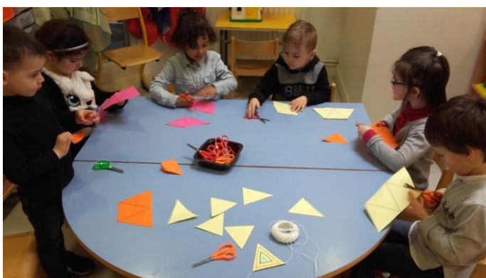
Nous avons décoré la classe avec des guirlandes de formes. Pour les triangles, nous avons découpé avec application sur les traits, puis nous avons tracé des triangles, à l'intérieur de la forme découpée. Nous avons fait pareil pour les ronds et les carrés. (MS)