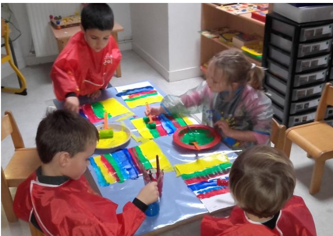
Nous traçons des lignes horizontales à l'aide d'un rouleau, et de gros pincesaux. (PS-MS)