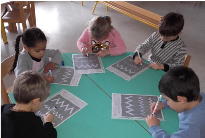
Nous nous entraînons à tracer des lignes brisées en repassant sur le modèle avec un feutre effaçable. (MS)