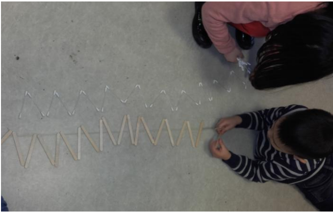
Nous utilisons des bâtonnets de glace et des cotons de tiges pour faire des lignes brisées. (MS)