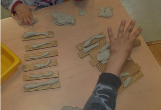
Nous faisons des lignes horizontales avec de la pâte à modeler et des kaplas. (TPS-PS-MS)

Après les lignes verticales en première période, nous avons découvert les lignes horizontales, les quadrillages, et en ce moment, nous essayons de tracer des lignes brisées, mais nous avons encore besoin d'entraînement !