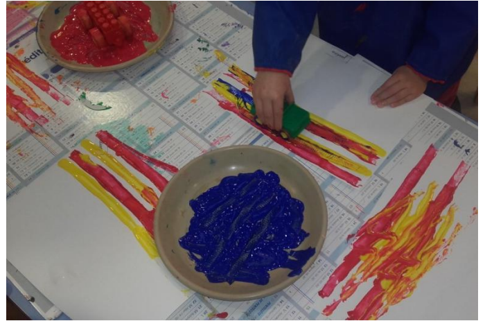
Nous traçons des lignes horizontales en roulant des petites voitures dans la peinture. C'est rigolo ! (TPS-PS-MS)