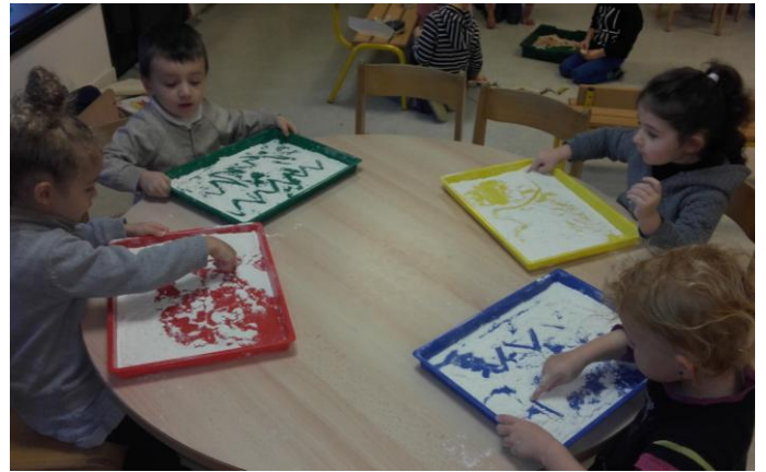
Nous essayons de tracer des lignes brisées dans la farine. (PS – MS)