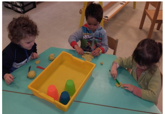
Nous traçons des quadrillages sur de la pâte à modeler, pour faire des « galettes ». (TPS-PS)