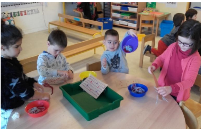
Nous utilisons de la laine et du carton pour faire un quadrillage (le filet pour attraper les poissons). (MS)